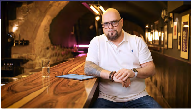
09 Aus der Lebenslinie das Lebenthema definieren